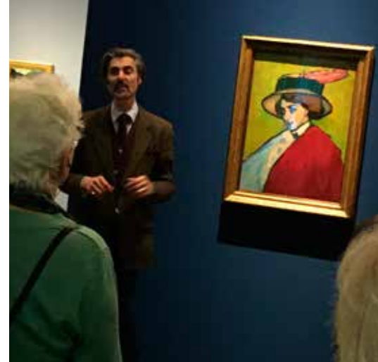
Ausstellung Gabriele Münter im Leopoldmuseum, alle Teilnehmer waren begeistert!