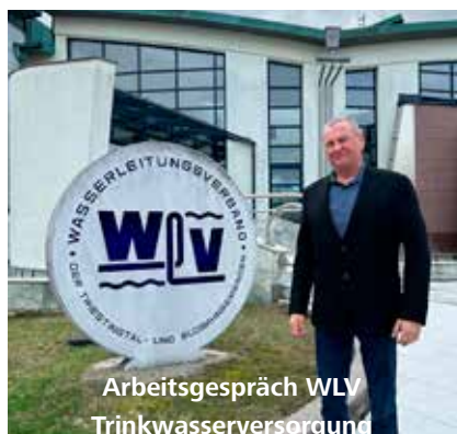
Arbeitsgespräch WLW Trinkwasserversorgung