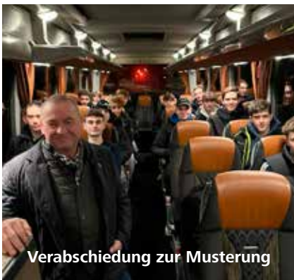
Verabschiedung zur Musterung