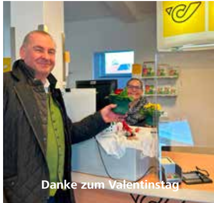
Danke zum Valentinstag