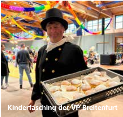
Kinderfasching der VP Breitenfurt